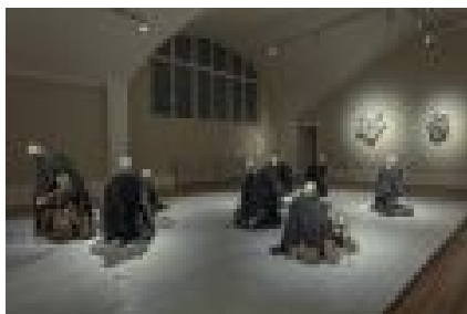
Mekaniska dockor på podium, blandteknik, mekatronik, 140 x 800 x 490 cm.