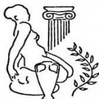
Västra Södermanlands Konstförening Katrineholm

Följ oss på vår hemsida https://strangnas.konstforeningar.se/ .