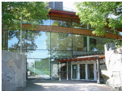
Aula Magna ritad av Ralph Erskine