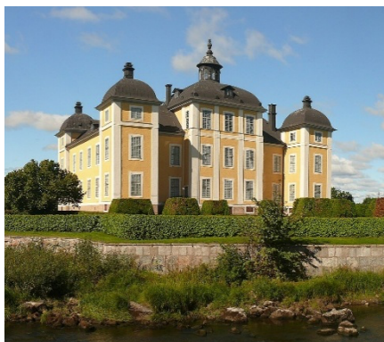
Strömsholms slott ritat av Nicodemus Tessin d.ä.