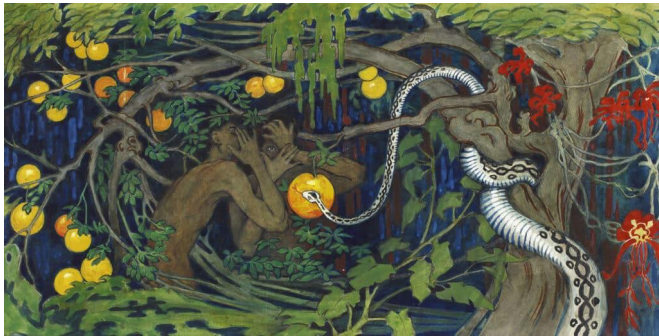
Bild: Tyra Kleen, Förbjuden frukt (Syndafallet), 1915. Riddarhuset/Valinge gård.

Vi besöker Ståhl Collection , där konstsammlaren Mikael Ståhl visar upp delar av sin omfattande samling av samtida konst. Samlingen består till stor del av måleri och skulptur av konstnärskap från slutet av 1950-talet fram till idag. Ståhl Collection visas i Yllefabriken, en gammal pampig fabriksbyggnad mitt i Norrköping.