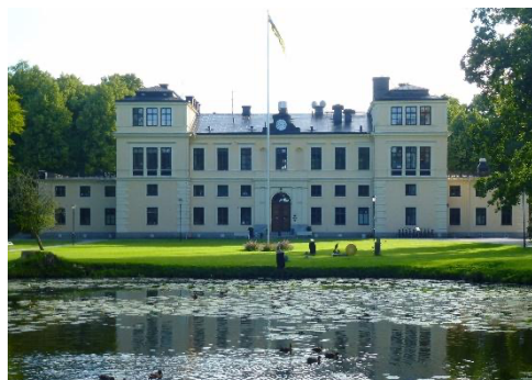
Bild: Rånäs slott

Längs vägen besöks Lasse Åbergs museum i Bålsta , där familjen Åberg gärna visar upp sin stora samling av modern popkonst.