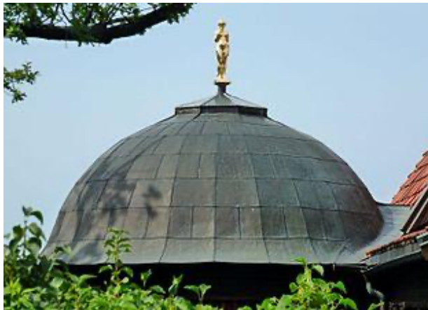
Bild: Museet innehåller 2 stora ateljéer och ett litet runt rum, ett tusculum (vilorum), med kopparklätt kupoltak och takfönster.

Vi börjar med besök i Carl Eldhs Ateljémuseum . Carl Eldh (1873–1954) var verksam som skulptör i Stockholm 1904–1954. Han utbildade sig i Stockholm och likt många samtida konstnärer även i Paris.