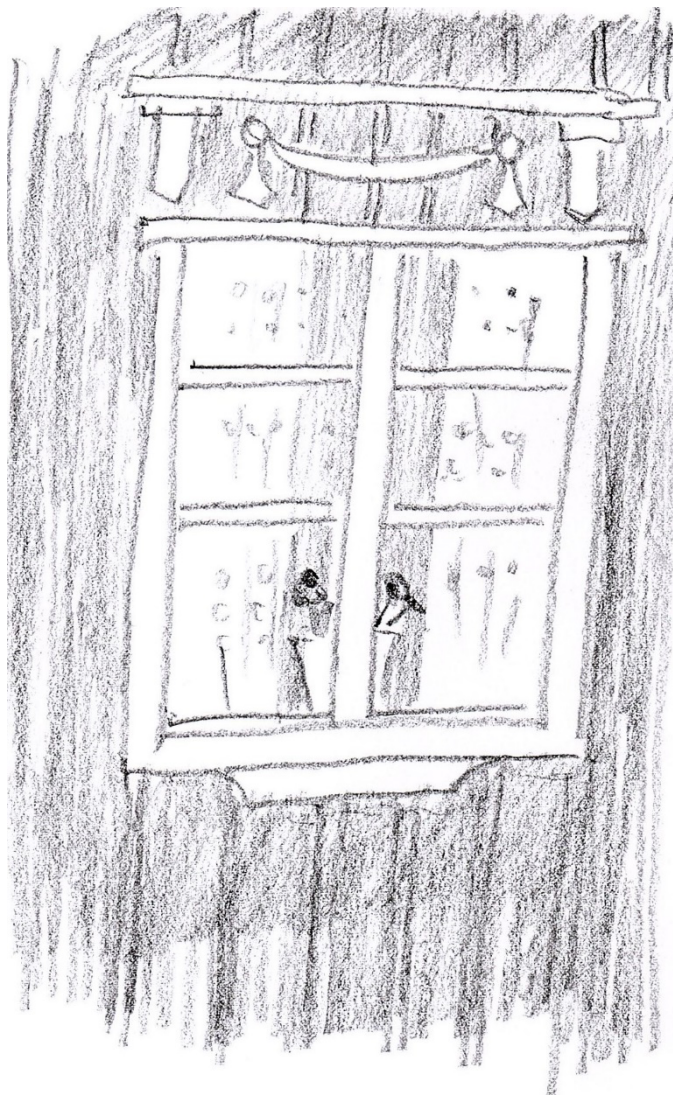
Text och teckningar Hans Lundén